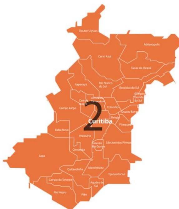
Figura 1 – Municípios que integram a 2ª regional de saúde do estado do Paraná.