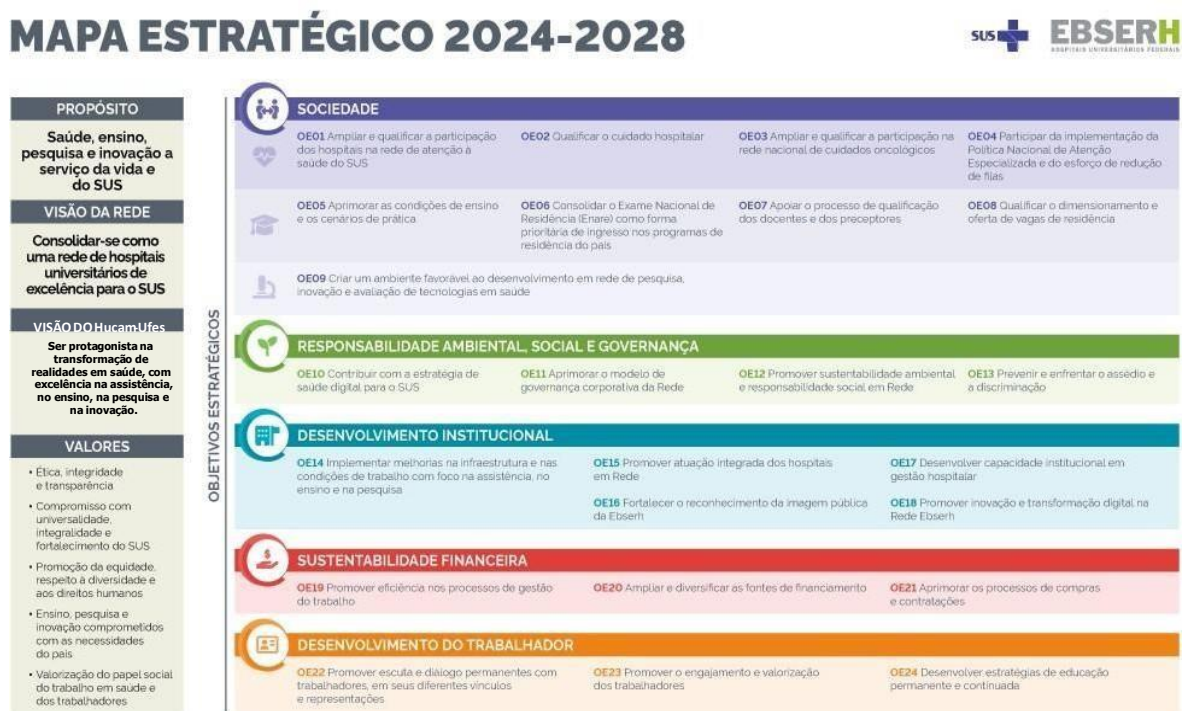
FIGURA 01 - Mapa Estratégico do Hucam-Ufes

Os projetos locais atendem a uma lógica de encadeamento estratégico, de modo a convergir ao alcance dos objetivos estratégicos do Hucam-Ufes (Figura 01) e objetivos da Rede Ebserh, considerando que o Hospital passou a integrar a rede de Hospitais Universitários Federais geridos pela Ebserh por meio do Contrato N° 1008/2013 assinado entre a Ufes e a referida Empresa Pública.