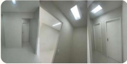
Adequações na Telessaúde e Unidade de Vigilância em Saúde