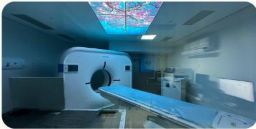
Figura 4: Renovação dos equipamentos de grande porte