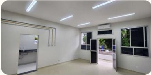
Adequações nas enfermarias 107 e 112: 1º andar da maternidade