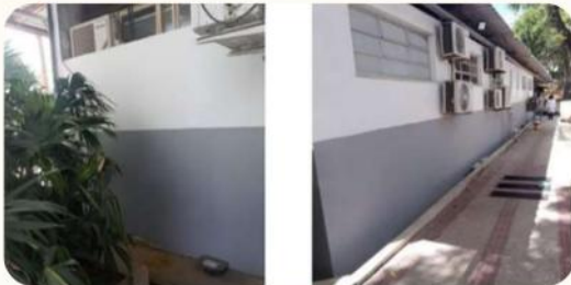
Revitalização da fachada dos ambulatórios (Casas 01 a 06)