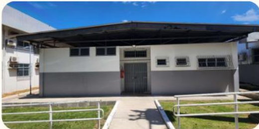
Adequações na casa 02 (Espaço para treinamentos e consultórios da USOST)