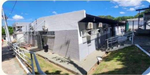
Adequações na casa 04 (TI, STCOR e Unidade Multiprofissional)