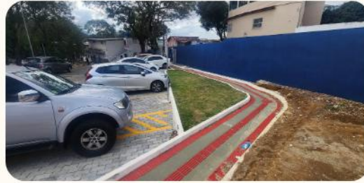
Acessibilidade para o Complexo Ambulatorial Multirreferenciado