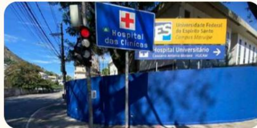
Revitalização do muro externo do Hucam-Ufes