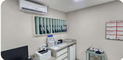
Adequações no posto de enfermagem da nefrologia