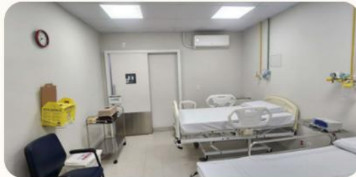
Adequações no hospital-dia