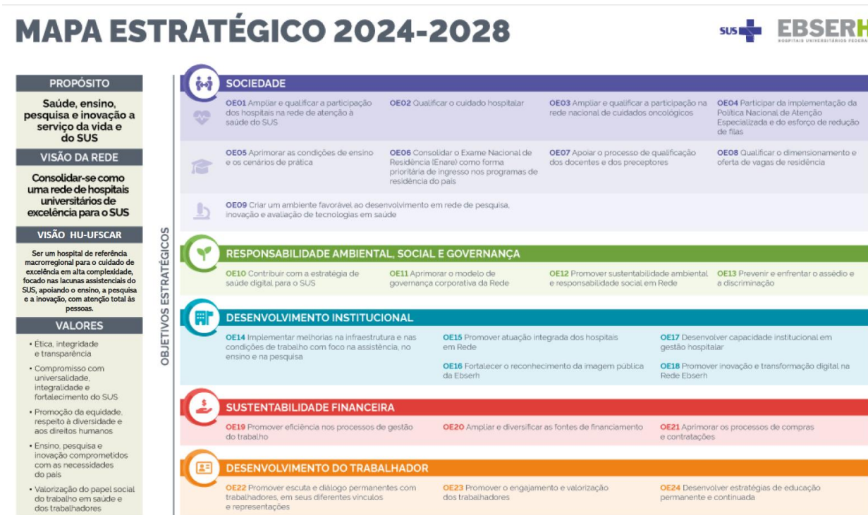
Figura 1 - Mapa estratégico EBSERH

Visando compreender a todos os compromissos estratégicos dos pilares estratégicos, foram propostos 24 (vinte e quatro) objetivos estratégicos , apresentados no Mapa a seguir.