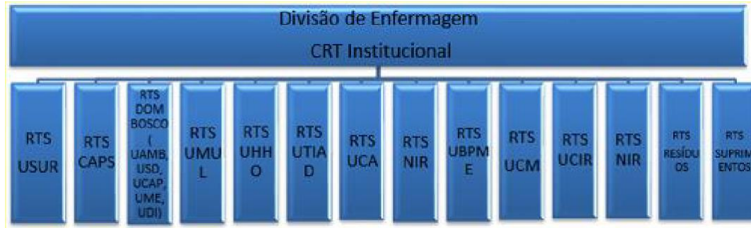
Figura 2 - Organograma da Estrutura da Divisão de Enfermagem