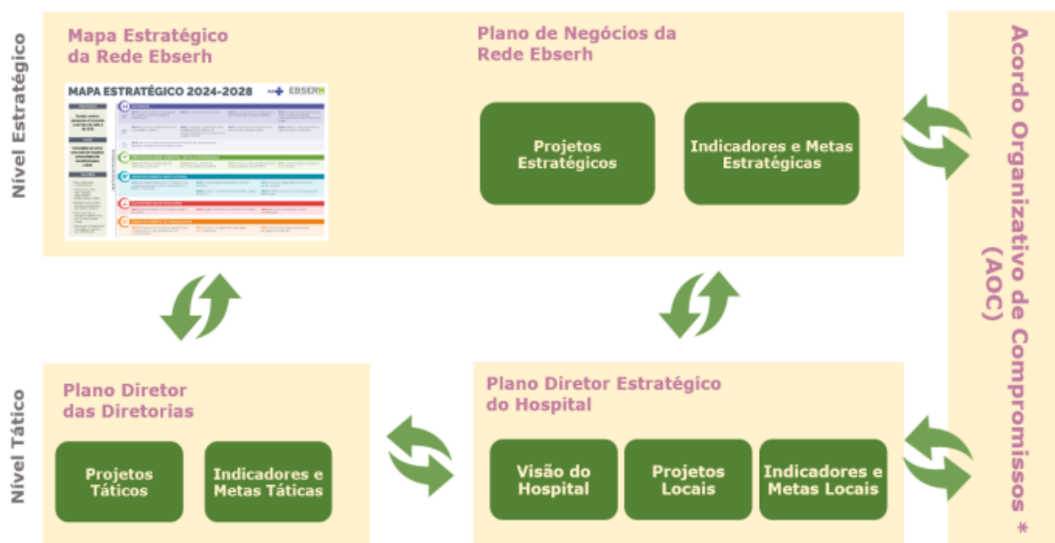
Figura 3: Modelo de Desdobramento da Estratégia da Rede Ebserh.