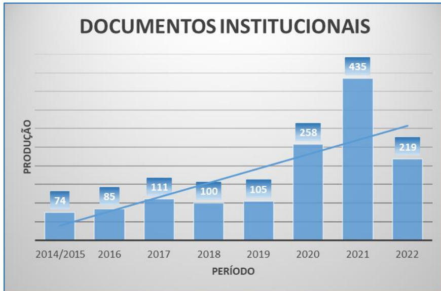
Figura 1 – Documentos Institucionais publicados por ano