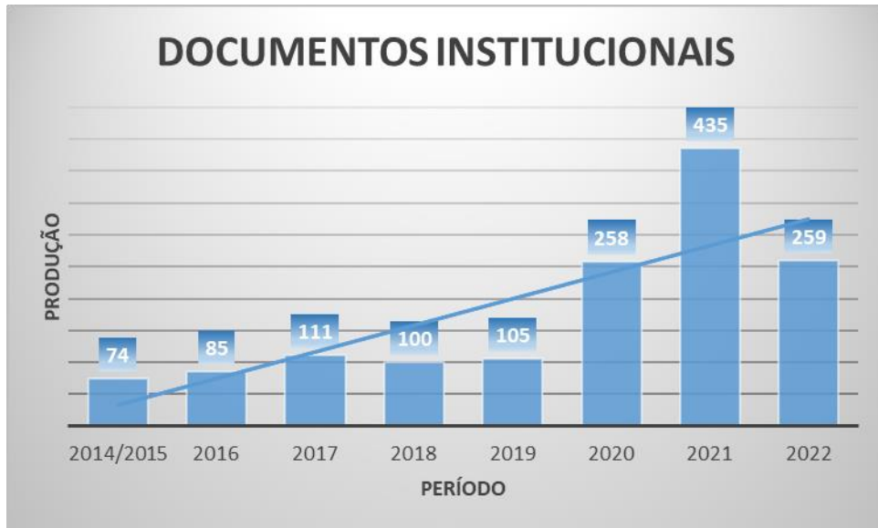
Figura 1 – Documentos Institucionais publicados por ano