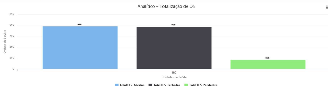
Gráfico Pizza Gráfico Coluna