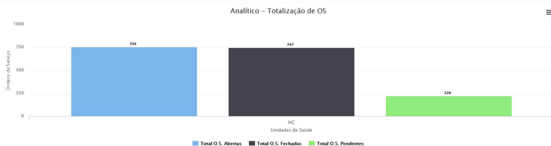
Gráfico Pizza Gráfico Coluna