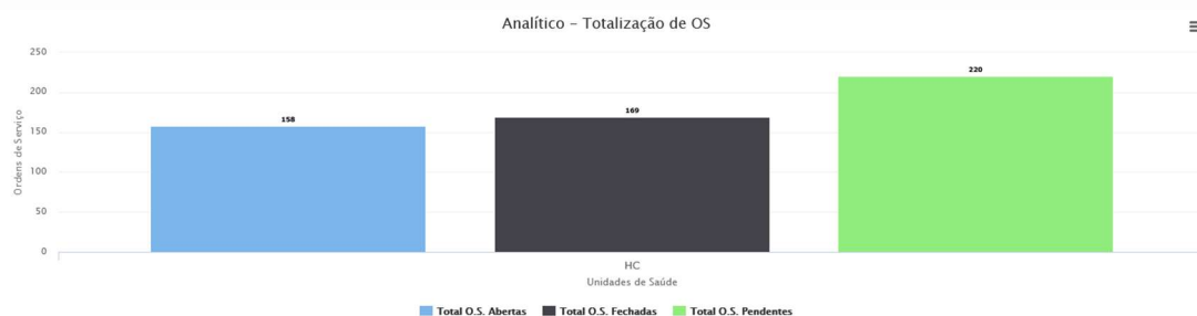
Gráfico Pizza Gráfico Coluna