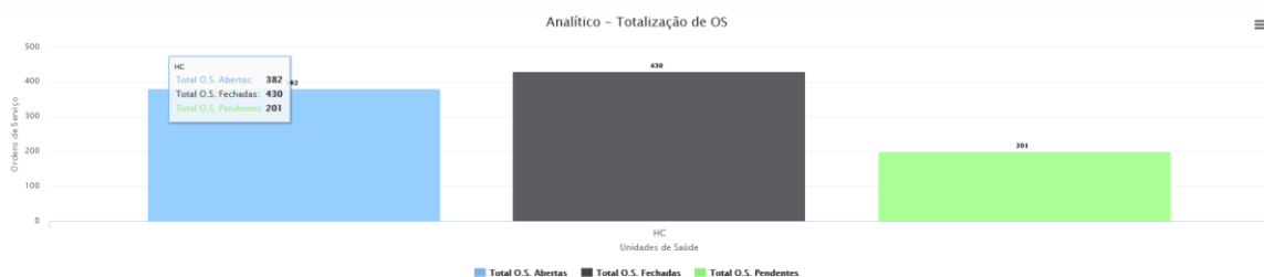
Gráfico Pizza Gráfico Coluna