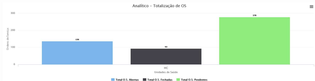
Gráfico Pizza Gráfico Coluna