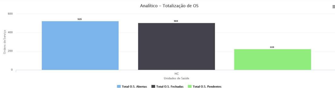
Gráfico Pizza Gráfico Coluna