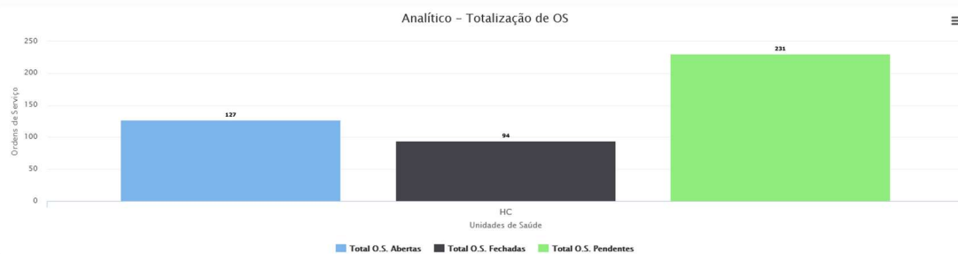
Gráfico Pizza Gráfico Coluna