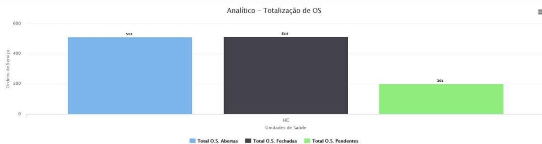
Gráfico Pizza Gráfico Coluna