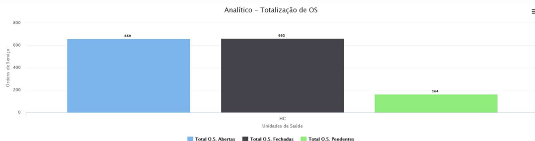
Gráfico Pizza Gráfico Coluna