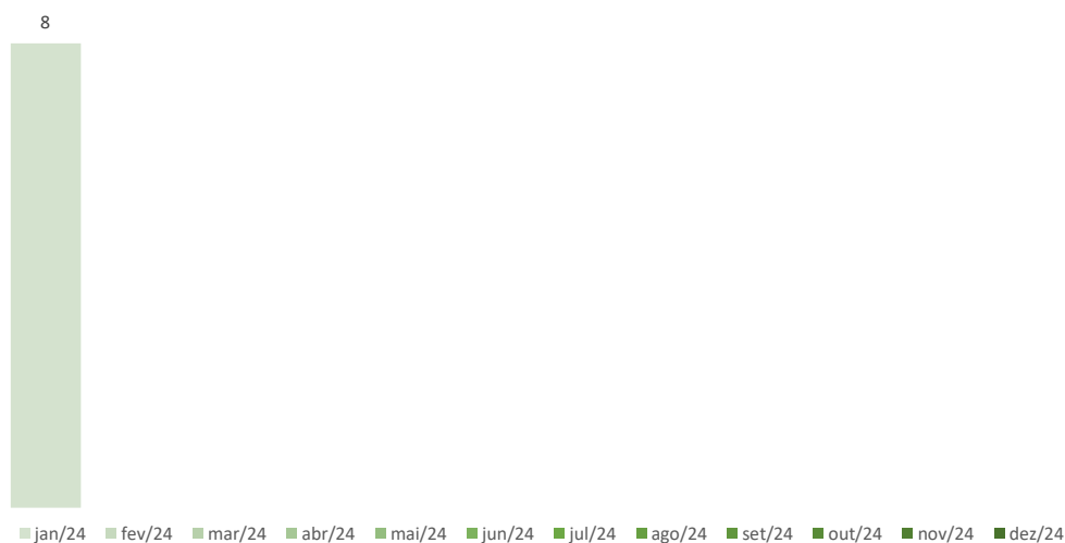
Número de Dispensas