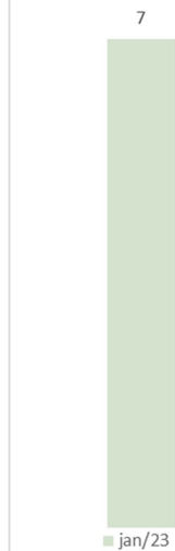
Número de Processos Licitatórios