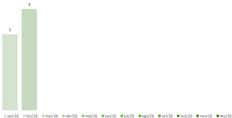
Número de Dispensas