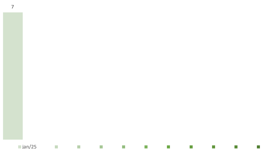
Número de Dispensas