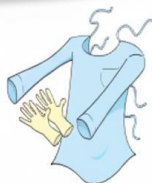
Luvas e Avental