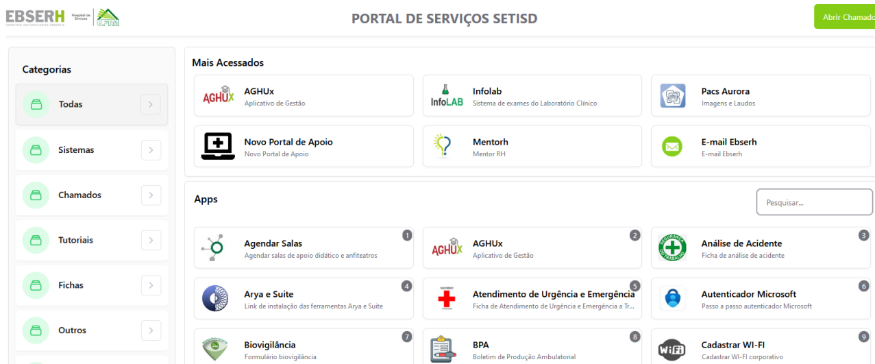
Figura 1 – Tela do Portal de Serviços