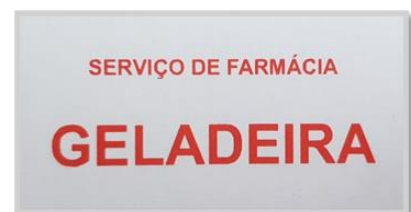
Figura 2 - Etiqueta de identificação de medicamento termolábil.