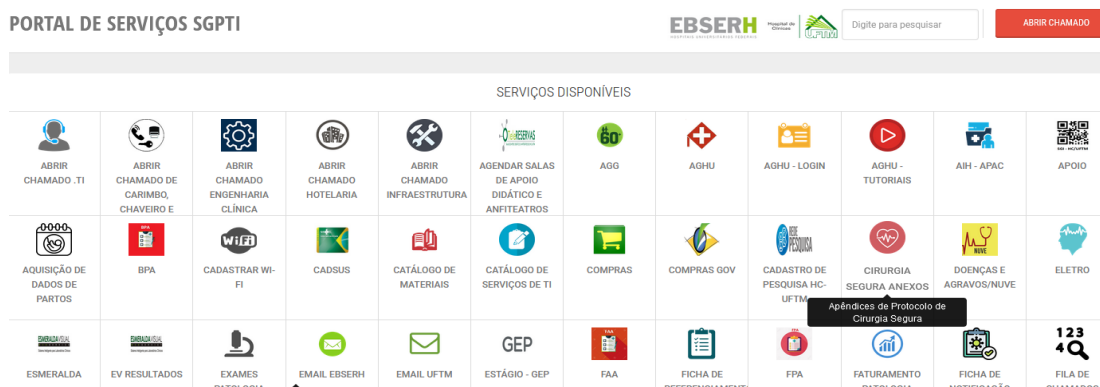
Figura 1 – Portal de Serviços – ícone Cirurgia Segura