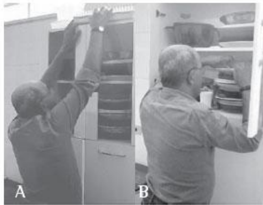
Figura 3 - A) Paciente realizando a atividade de guardar utensílios em prateleiras altas sem a utilização das técnicas de conservação de energia; B) Paciente realizando a atividade de guardar utensílios em prateleiras altas utilizando as técnicas de conservação de energia

Nas figuras 3 e 4 são apresentadas a organização do ambiente e os objetos de uso frequente, que evitam grandes amplitudes de movimento para guardar seus utensílios em lugares muito altos ou muito baixos.