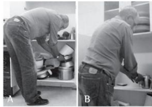
Figura 4 - A) Paciente realizando a atividade de guardar utensílios em prateleiras baixas sem a utilização das técnicas de conservação de energia; B) Paciente realizando a atividade de guardar utensílios em prateleiras baixas utilizando as técnicas de conservação de energia