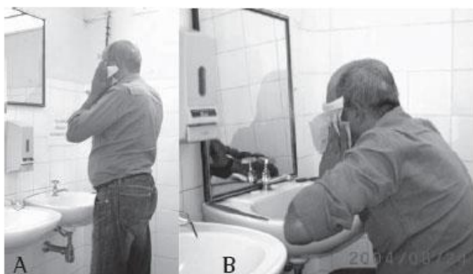
Figura 1 - A) Paciente realizando as atividades de higiene pessoal sem a utilização das técnicas de conservação de energia; B) Paciente realizando as atividades de higiene pessoal utilizando as técnicas de conservação de energia

A figura 1 mostra que ao abaixar o espelho do banheiro, evita-se que o paciente faça sua higiene pessoal na posição ortostática e com os membros superiores sem apoio.