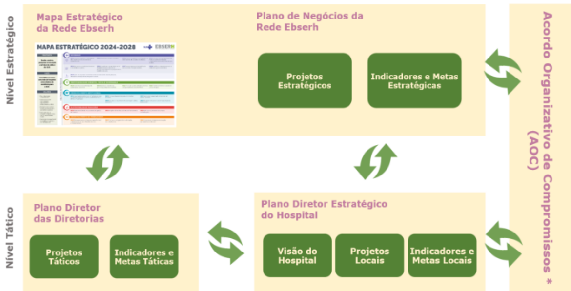
Figura 3: Modelo de Desdobramento da Estratégia da Rede Ebserh.