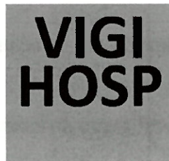
Figura 01: Ícone do VIGIHOSP.