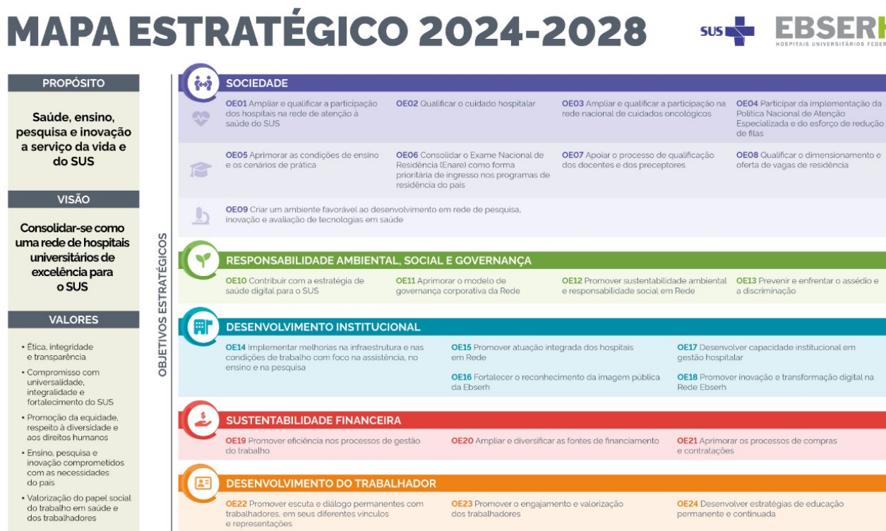
Figura 1. Mapa Estratégico da Rede Ebsersh 2024 – 2028

A Ebsersh, tendo por missão ensinar para transformar o cuidar, busca implementar as melhores práticas em todos os processos institucionais e, no campo da gestão de suprimentos, identificar e sanar deficiências, por vezes existentes, na cadeia de suprimentos em suas unidades hospitalares . Trabalhar de modo confiável, com base em modelos de previsão da necessidade de ressurgimento de produtos para saúde e medicamentos em uma unidade hospitalar, consiste em realizar estudos minuciosos e específicos, devido às incertezas que configuram o comportamento da demanda dos serviços oferecidos por um hospital. Nesse contexto, a elaboração da proposta de melhoria dos processos logístico-hospitalares visa otimizar os recursos existentes e minimizar os riscos à saúde do paciente.