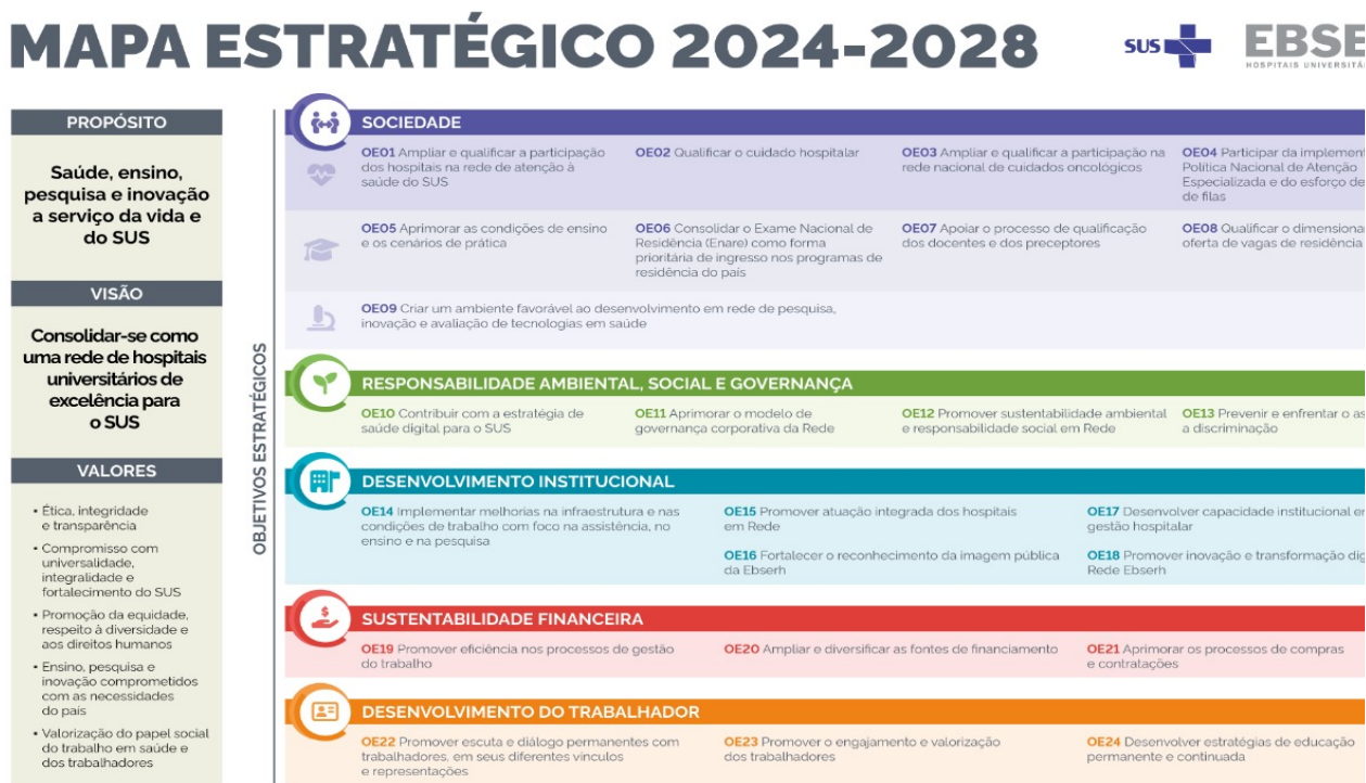
Figura 1. Mapa Estratégico da Rede Ebserh 2024 – 2028

A Ebserh, tendo por missão ensinar para transformar o cuidar, busca implementar as melhores práticas em todos os processos institucionais e, no campo da gestão de suprimentos, identificar e sanar deficiências, por vezes existentes, na cadeia de suprimentos em suas unidades hospitalares . Trabalhar de modo confiável, com base em modelos de previsão da necessidade de ressuprimento de produtos para saúde e medicamentos em uma unidade hospitalar, consiste em realizar estudos minuciosos e específicos, devido às incertezas que configuram o comportamento da demanda dos serviços oferecidos por um hospital. Nesse contexto, a elaboração da proposta de melhoria dos processos logístico-hospitalares visa otimizar os recursos existentes e minimizar os riscos à saúde do paciente.