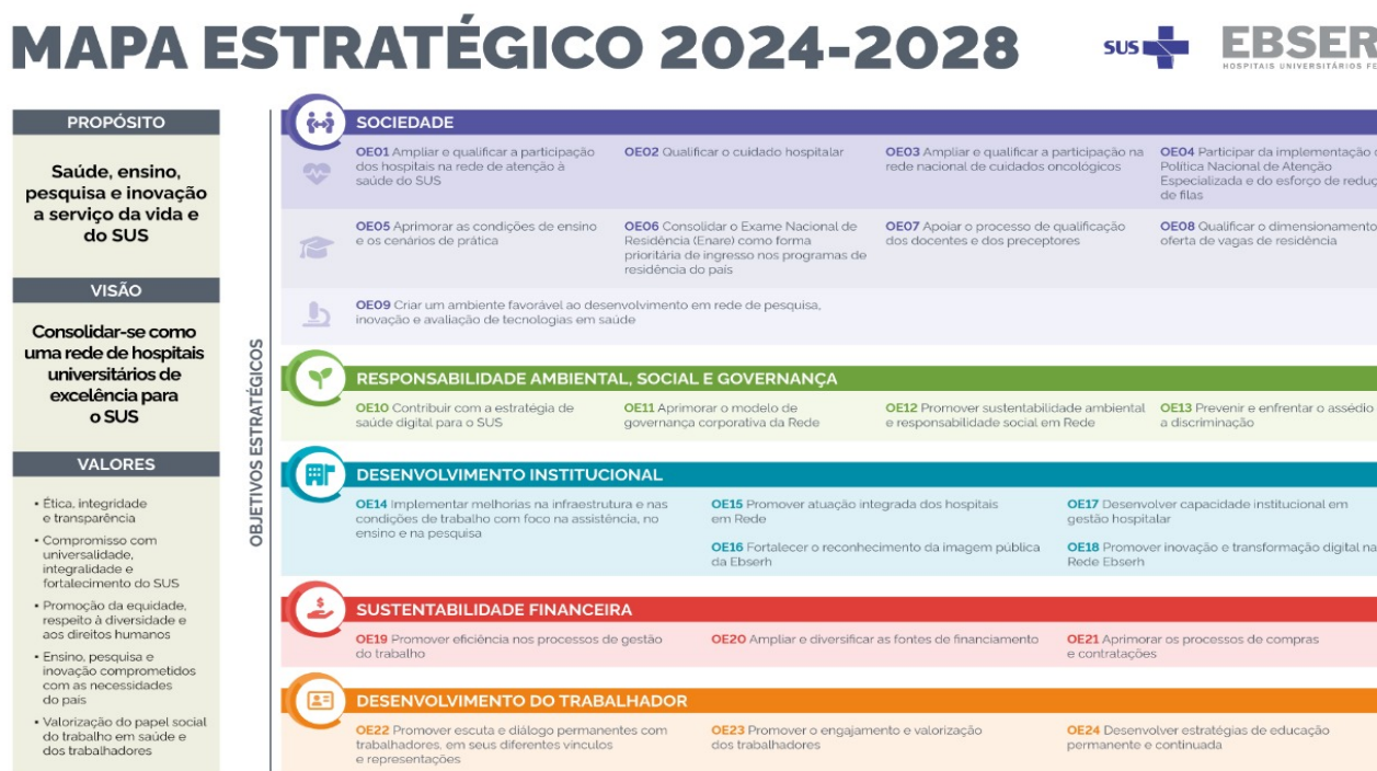
Figura 1. Mapa Estratégico da Rede Ebserh 2024 – 2028

A Ebserh, tendo por missão ensinar para transformar o cuidar, busca implementar as melhores práticas em todos os processos institucionais e, no campo da gestão de suprimentos, identificar e sanar deficiências, por vezes existentes, na cadeia de suprimentos em suas unidades hospitalares . Trabalhar de modo confiável, com base em modelos de previsão da necessidade de ressuprimento de produtos para saúde e medicamentos em uma unidade hospitalar, consiste em realizar estudos minuciosos e específicos, devido às incertezas que configuram o comportamento da demanda dos serviços oferecidos por um hospital. Nesse contexto, a elaboração da proposta de melhoria dos processos logístico-hospitalares visa otimizar os recursos existentes e minimizar os riscos à saúde do paciente.