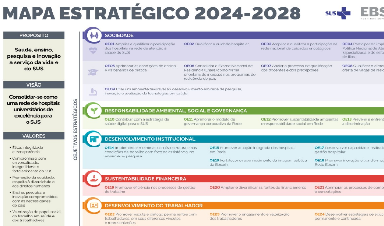
Figura 1. Mapa Estratégico da Rede Ebserh 2024 – 2028

A Ebserh, tendo por missão ensinar para transformar o cuidar, busca implementar as melhores práticas em todos os processos institucionais e, no campo da gestão de suprimentos, identificar e sanar deficiências, por vezes existentes, na cadeia de suprimentos em suas unidades hospitalares . Trabalhar de modo confiável, com base em modelos de previsão da necessidade de ressurgimento de produtos para saúde e medicamentos em uma unidade hospitalar, consiste em realizar estudos minuciosos e específicos, devido às incertezas que configuram o comportamento da demanda dos serviços oferecidos por um hospital. Nesse contexto, a elaboração da proposta de melhoria dos processos logístico-hospitalares visa otimizar os recursos existentes e minimizar os riscos à saúde do paciente.