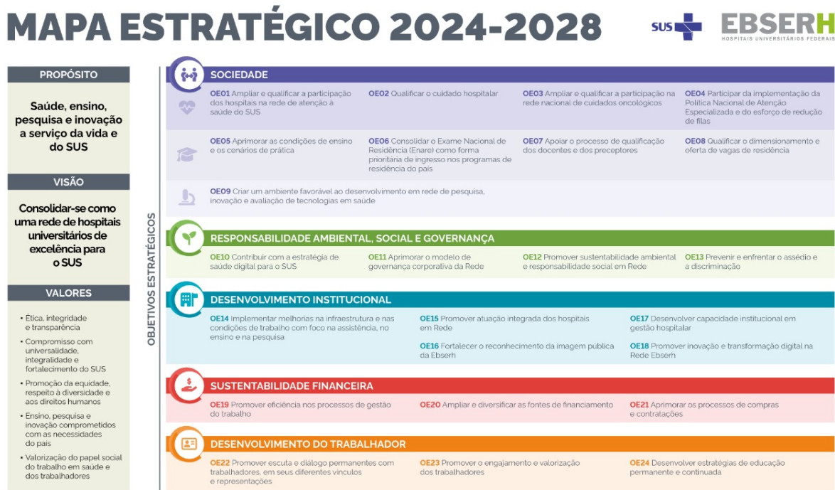
Figura 1. Mapa Estratégico da Rede Ebsersh 2024 – 2028