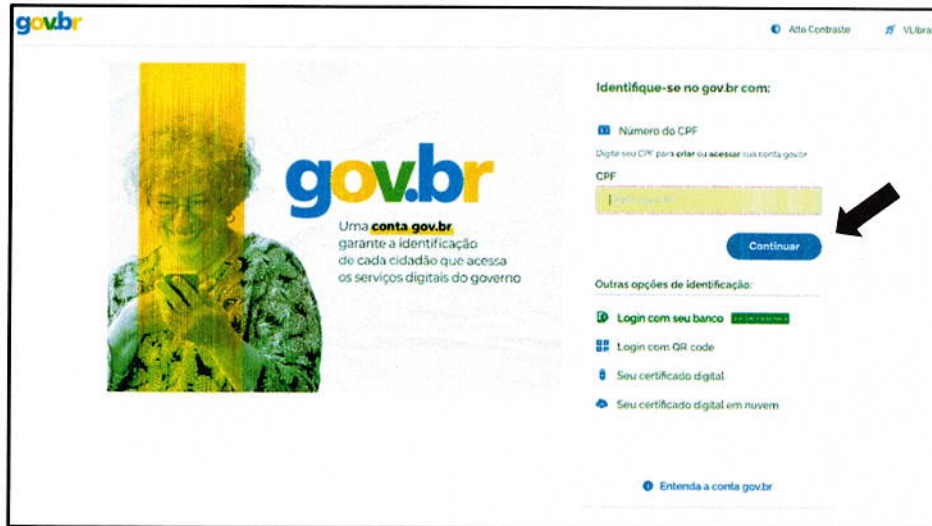
Figura 2 - Tela inicial para acesso ao gov.br.