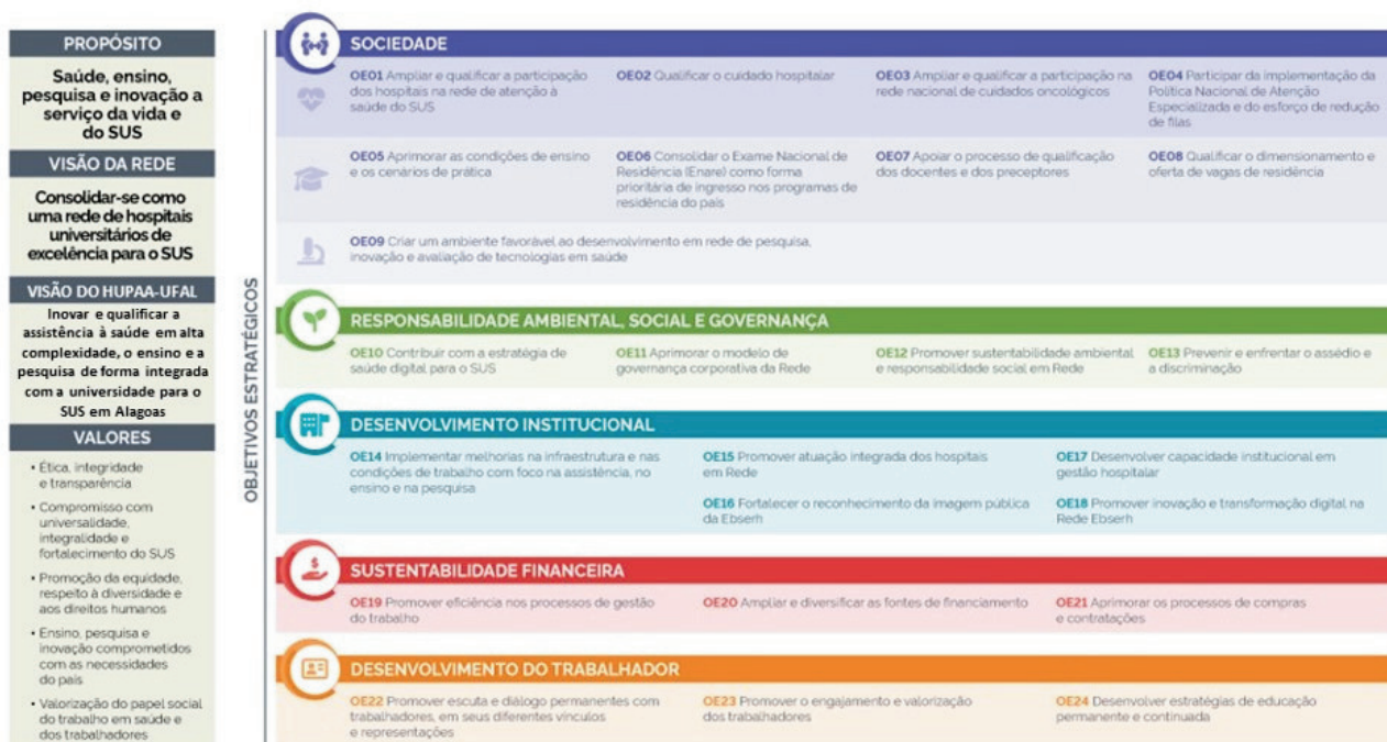
Figura 01 - Mapa Estratégico da Rede Ebserh – Hupaa-Ufal – 2024-2028.

Visando compreender a todos os compromissos estratégicos dos pilares estratégicos, foram propostos 24 (vinte e quatro) objetivos estratégicos apresentados no Mapa, conforme pode ser visualizado na Figura 01.