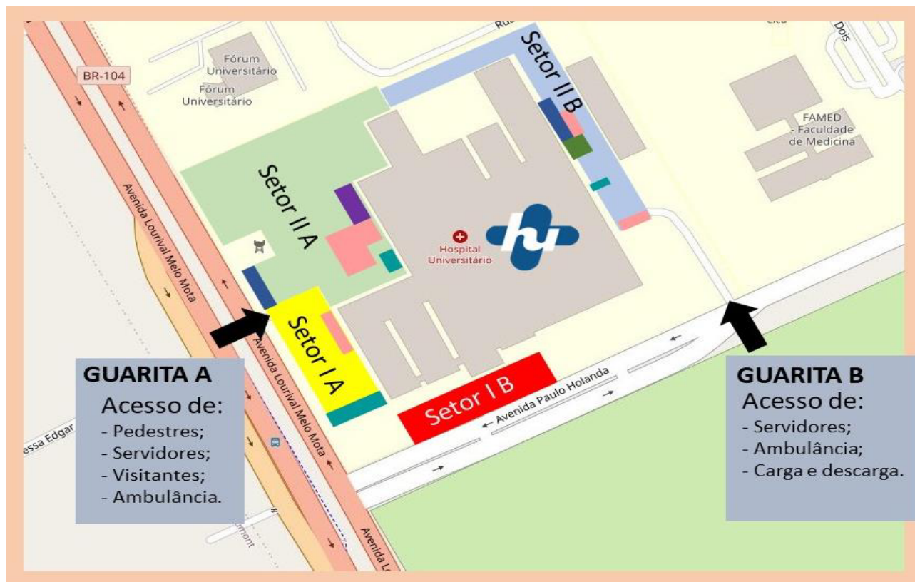
Figura 02 - Mapa esquemático com indicação de vias, acessos e classificação do estacionamento por setores para o HUPAA/UFAL.