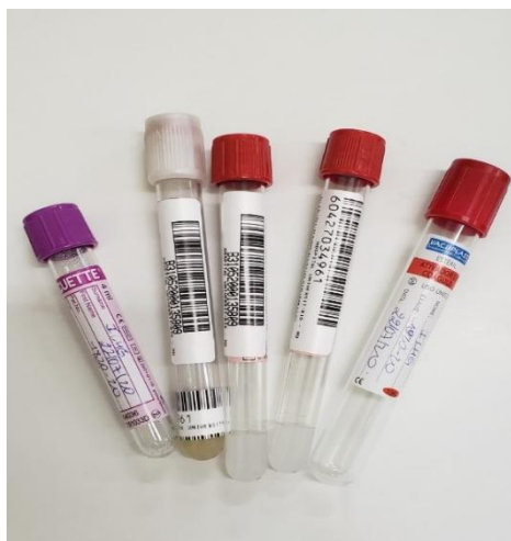
Figura 1- Rotulagem correta dos tubos