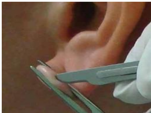
Figura 1. Descrição do Procedimento “Pregueamento do sítio de coleta (isquemia) e incisão para coleta do material”