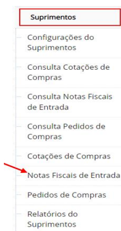
Figura 10 – Janela de suprimentos