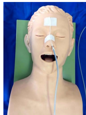
Fixação em tira

Fonte: Silveira e Romeiro, 2018; UFPE-UNASUS, 2014;