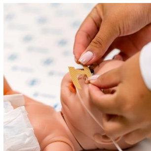
Fixação em “H”