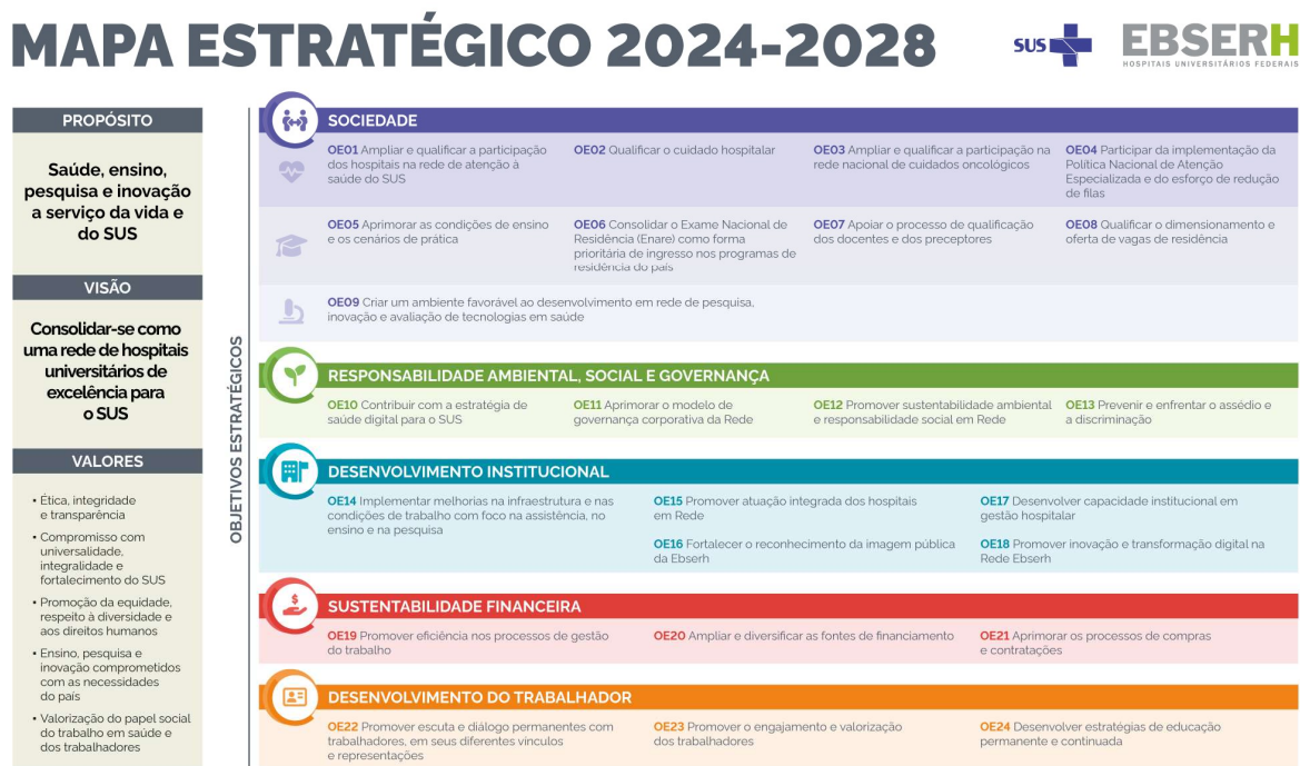
Figura 2: Mapa estratégico Ebserh 2024-2028.

Alinhados com todos os compromissos estratégicos dos pilares, foram propostos 24 (vinte e quatro) objetivos estratégicos, organizados em sete temas: Sociedade (Pesquisador), Sociedade (Usuário SUS), Sociedade (Estudante), Desenvolvimento do Trabalhador, Responsabilidade Ambiental, Social e Governança, Sustentabilidade Financeira e Desenvolvimento Institucional. A partir disso, construiu-se o Mapa Estratégico da Ebserh 2024-2028, o qual demonstra seus objetivos estratégicos, bem como direciona o Plano Anual de Compras (PAC) 2026 da Rede Ebserh.