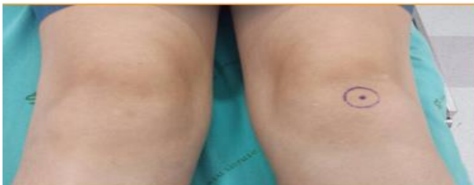
Figura 01. Demarcação de Lateralidade.