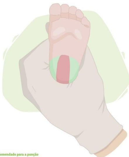
Imagem 1. Local recomendado para a punção

Figura 02: Demonstração dos locais de punção no na região plantar do calcanhar do RN.