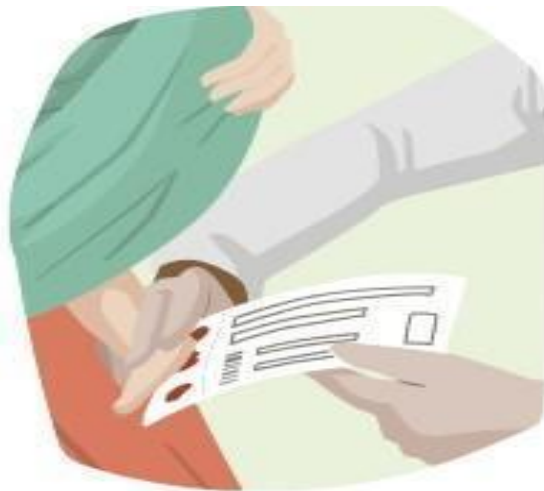
Figura 03: Demonstração da colocação do sangue no cartão.