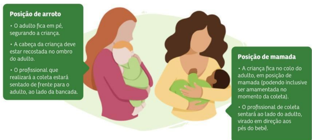
Figura 01: Demonstração da posição de arrote e da posição de mamada.