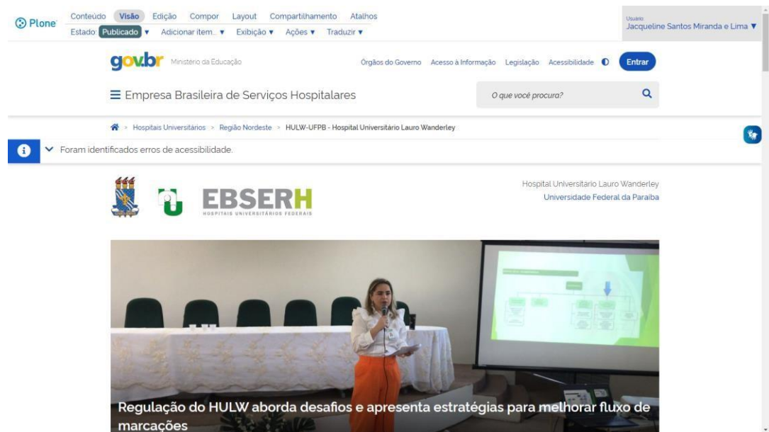
Figura 01: Página inicial do portal do HULW