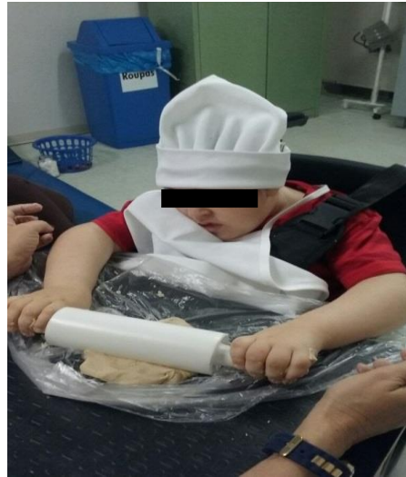
Foto 2: Treinamento de atividade de vida diária, ajuste postural e coordenação motora

As mãos devem ser higienizadas em momentos essenciais e necessários de acordo com o fluxo de cuidados assistenciais para prevenção de IRAS (infecções relacionadas à assistência à saúde) causadas por transmissão cruzada pelas mãos conforme orientações do POP/CCIH/001/2019.