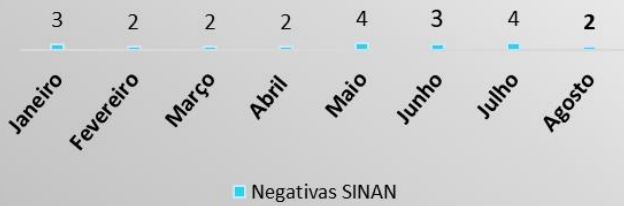
Semanas Com Notificação Negativa (SINAN)