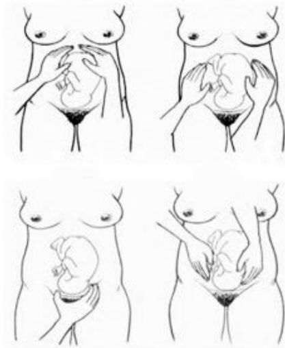
Figura 1 — Palpação obstétrica

BRASIL. MINISTÉRIO DA SAÚDE. Secretaria de Atenção à Saúde. Departamento de Atenção Básica. Atenção ao pré-natal de baixo risco. Brasília: Editora do Ministério da Saúde, 2012.