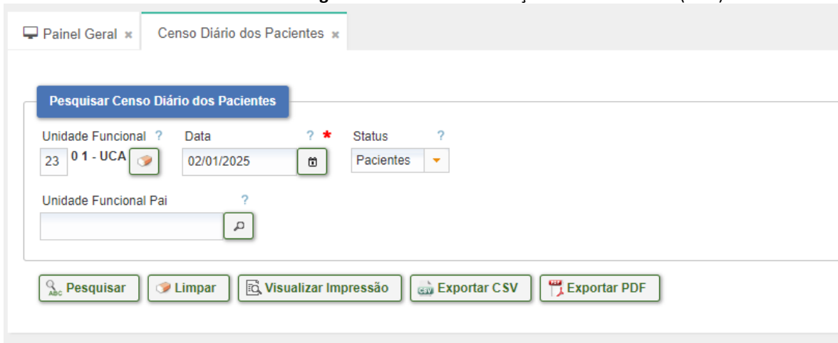
Figura 3 – Unidade da Criança e do Adolescente (UCA)