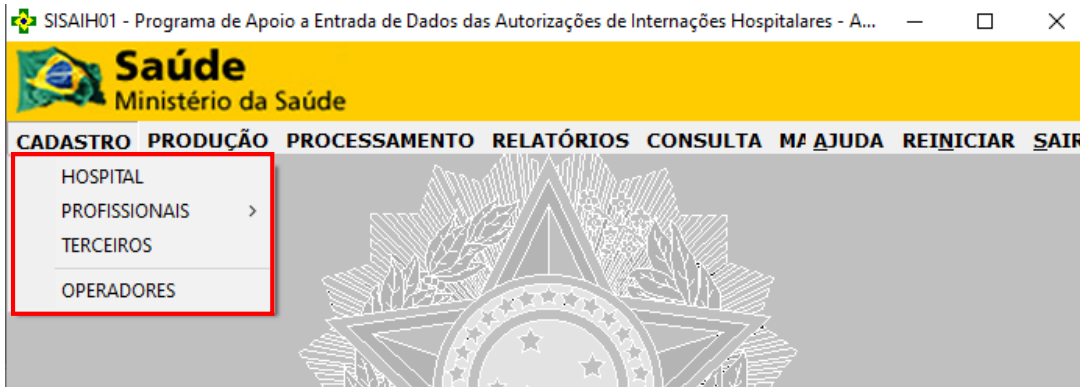
Figura 3 - Menu Cadastro no SISAIH01.