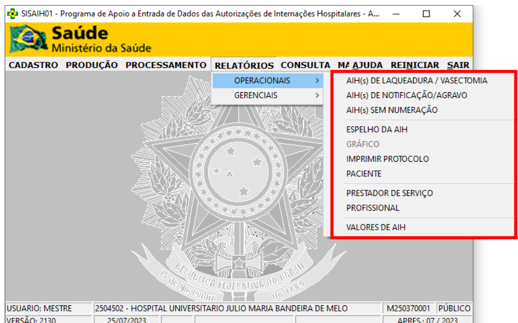
Figura 7 - Menu Relatórios do SISAIH01.