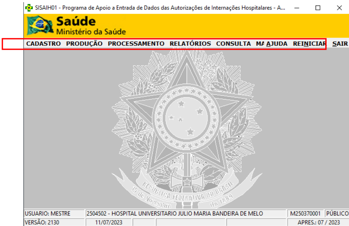
Figura 2 - Tela inicial do SISAIH01