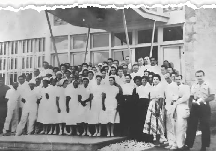
Funcionários técnicos e administrativos do H.A.C

Mais recentemente, em dezembro de 2015, a unidade hospitalar passou a ser gerida pela Empresa Brasileira de Serviços Hospitalares (Ebserh), empresa pública vinculada ao Ministério da Educação (MEC). Atualmente a Ebserh administra 45 hospitais universitários federais, apoiando e impulsionando suas atividades.